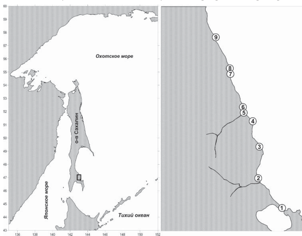
Рис. 1. Карта-схема района исследований; кружками показаны станции отбора проб ихтиофауны

Сбор материала по численности и питанию рыб проводился на девяти станциях на отрезке морского побережья юго-восточного Сахалина длиной в 19 км в районе р. Долинка (рис. 1). В связи с неблагоприятными погодными условиями (шторм, накат) в ходе каждого выезда на полевые работы обловы проводились не на всех станциях. Работы по оценке фоновых показателей прочих видов ихтиофауны проводились параллельно сборам молоди лососей и включали учетные неводные обловы на вышеуказанных девяти станциях, и дополнительный сбор материала на биоанализ при помощи разноячейных сетей. Исследования проводились в мае (15–18.05), июне (два выезда – 04–05.06 и 26.06) и июле (04–10.07). В ходе каждого выезда обловы прибрежных рыб удавалось выполнить также лишь на 5–8 станциях в связи с неблагоприятными погодными условиями на отдельных участках побережья в период работ.